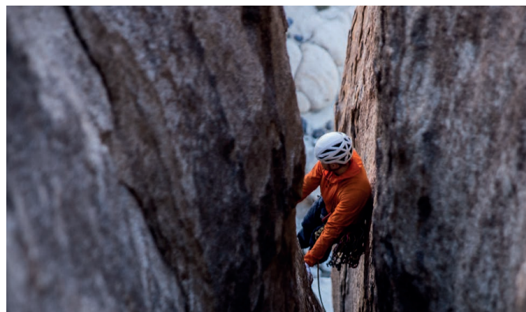
Figure 1 : Le réverso permet d'assurer un ou deux grimpeur à la fois.

Release of one second Calata di un secondo