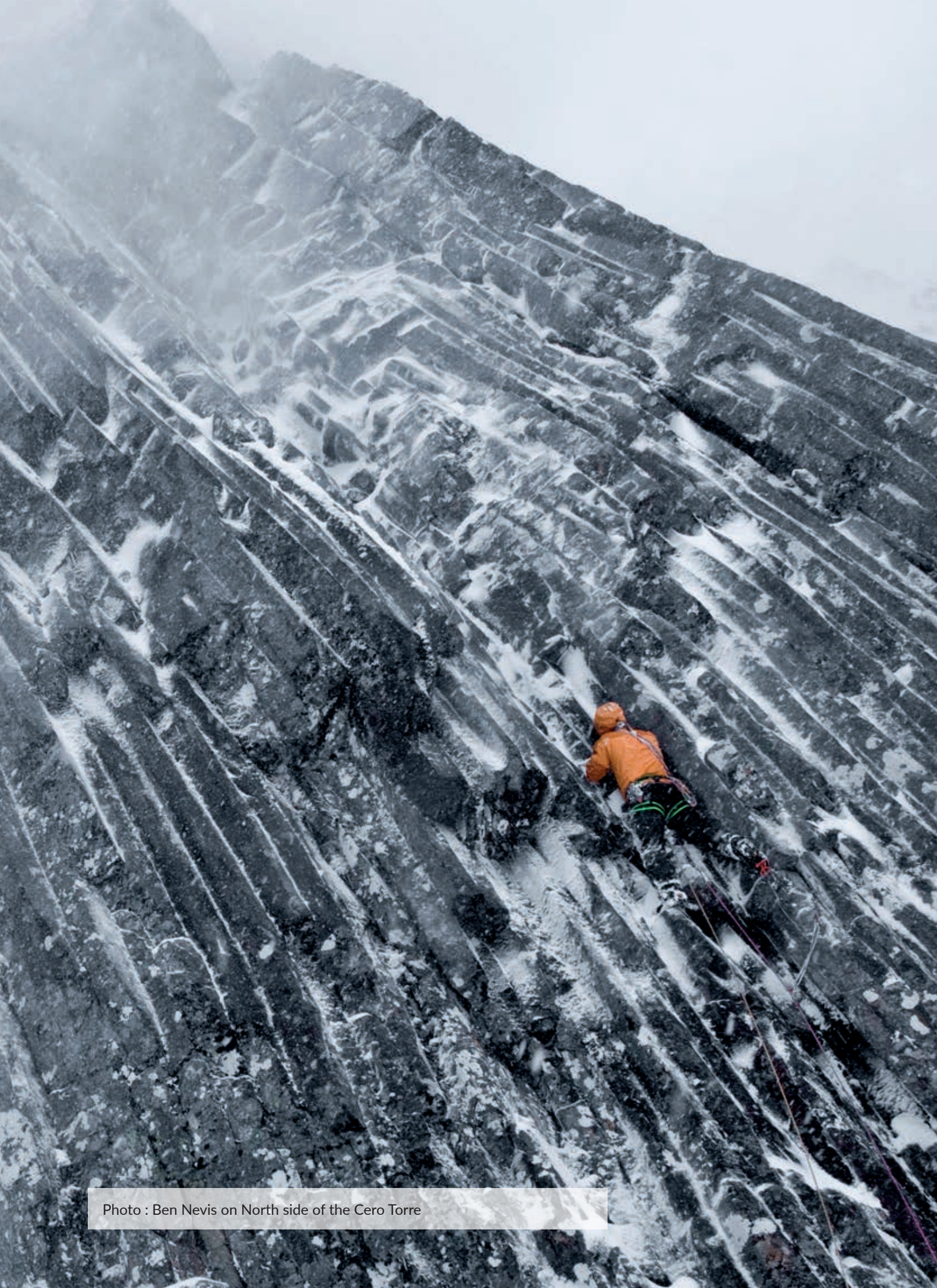
Photo : Ben Nevis on North side of the Cero Torre